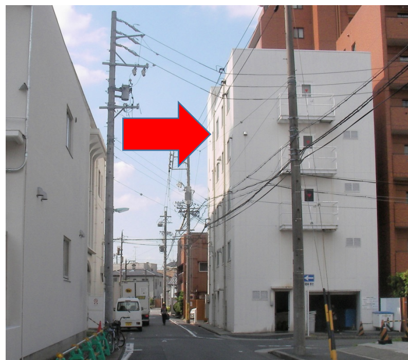
病院西側通向かいの西棟5階が会場